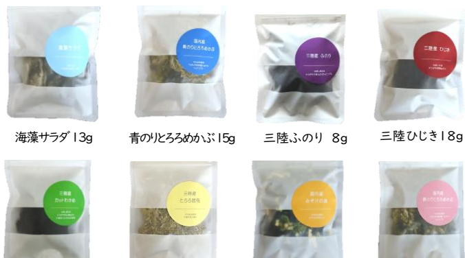
1個 250円(本体) [270円(税込)]