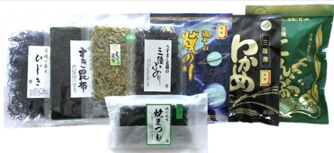
セット① 4,630円(本体) [5,000円(税込)]