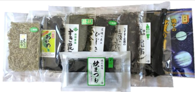
セット② 4,630円(本体) [5,000円(税込)]