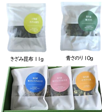
3個入セット ※組み合わせ自由