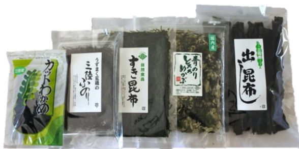
セット⑤ 1,852円(本体) [2,000円(税込)]