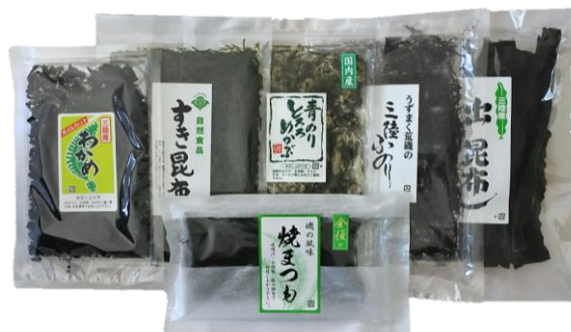
セット④ 2,778円(本体) [3,000円(税込)]