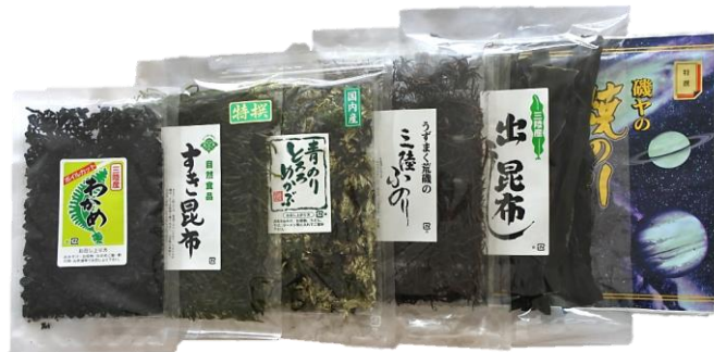
セット③ 3,704円(本体) [4,000円(税込)]