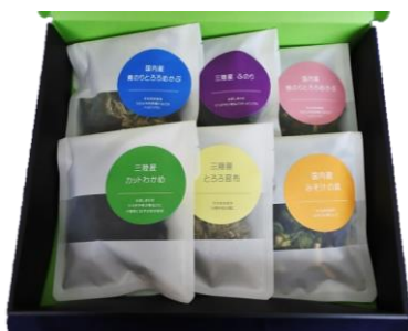
6個入セット ※組み合わせ自由 1,650円(本体) [1,782円(税込)]