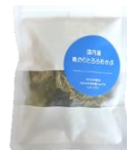
青のりとろろめかぶ 15g