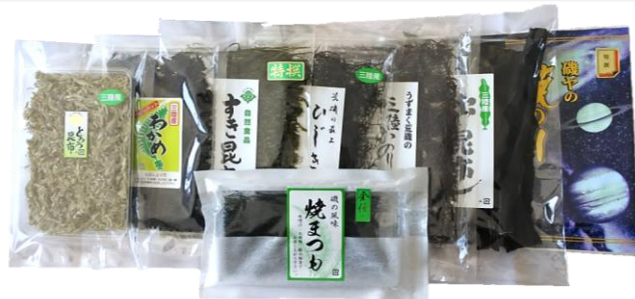
セット② 4,630円(本体) [5,000円(税込)]