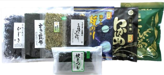
セット① 4,630円(本体) [5,000円(税込)]